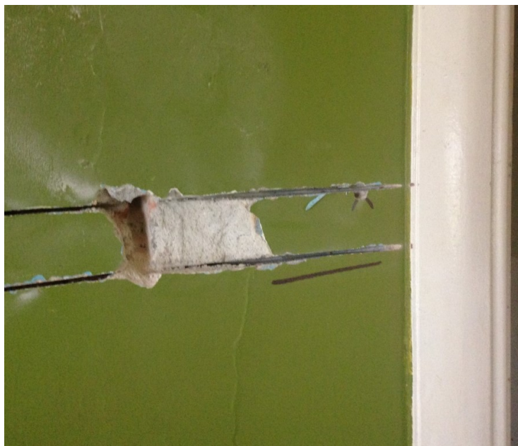
Ilustración 3 - Cateo de pilar