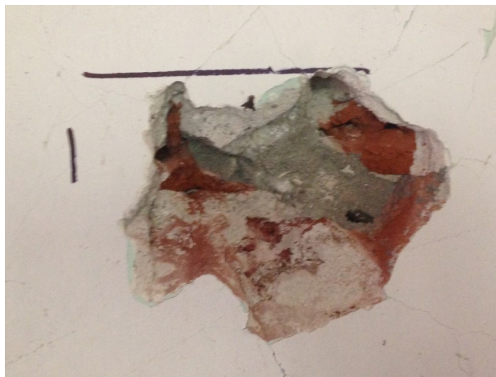
Ilustración 5 - Cateo de pilar