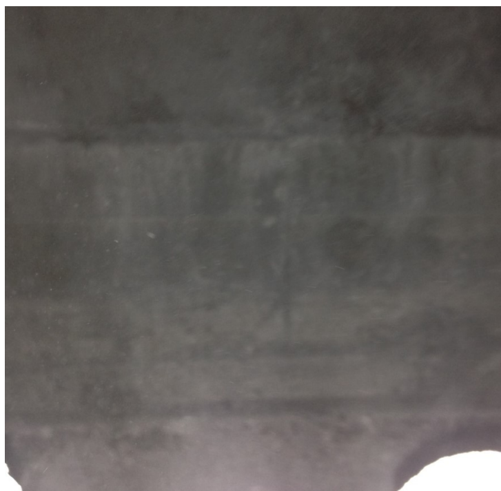
Ilustración 6- Cateo de vigas