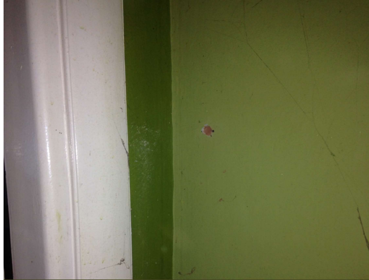
Ilustración 1 - Cateo de pilar

Se presenta relevamiento fotográfico del relevamiento.