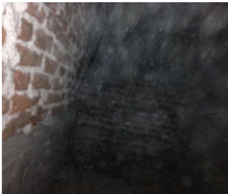
Ilustración 7 - Cateo de viga