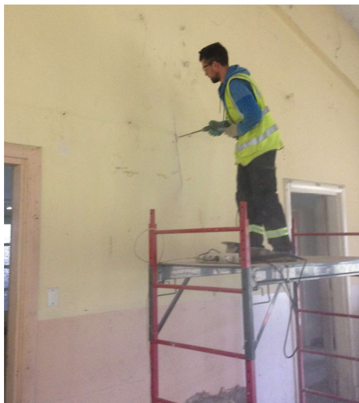
Ilustración 4 - Cateo de viga dintel